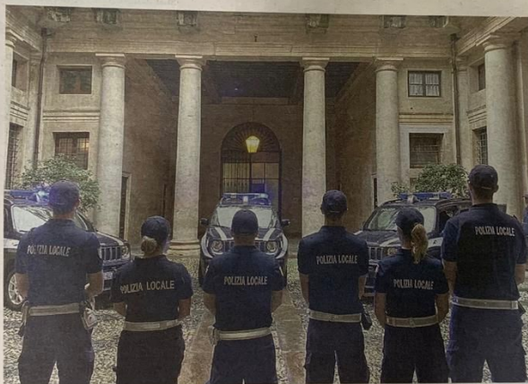
Sicurezza Più di qualcuno ha abbandonato volontariamente la polizia locale nel 2024